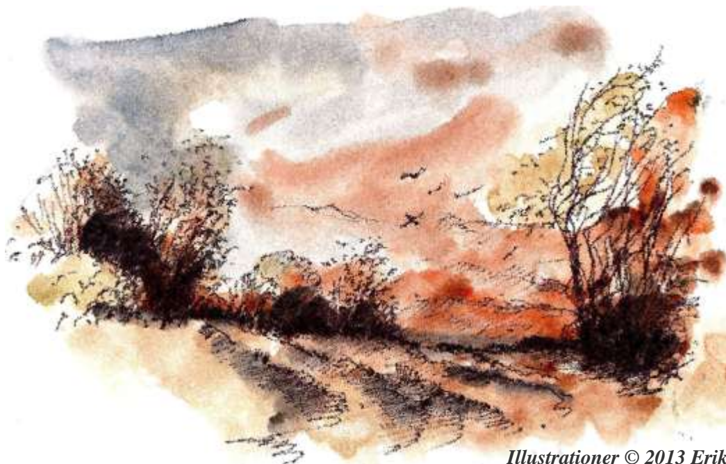
Illustrationer © 2013 Erik Bay