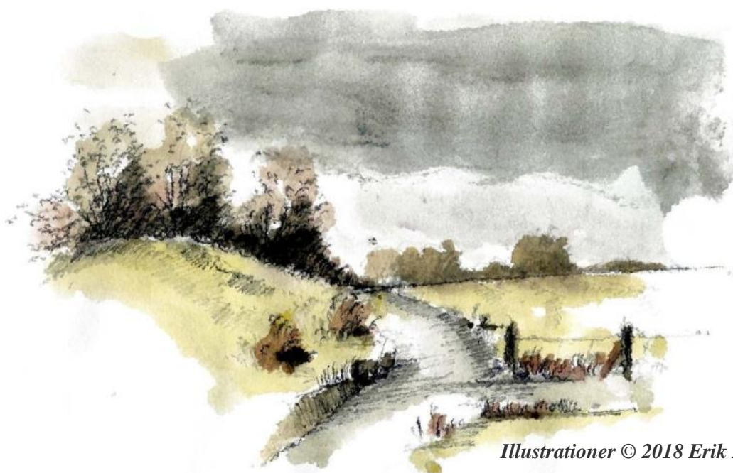
Illustrationer © 2018 Erik Bay