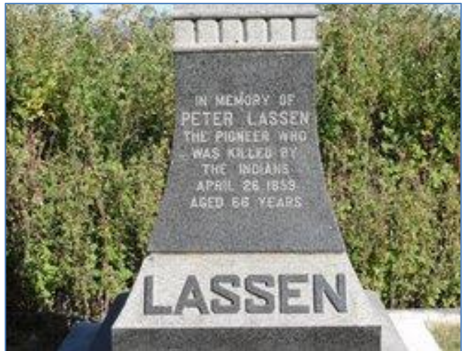
Indgravningen på monumentet:

In memory of / Peter Lassen / the pioneer who / was killed by / the indians / April 26 1859 / Aged 66 Years / LASSEN. Bemærk, at hans alder er forkert angivet. Han blev kun 58 år.