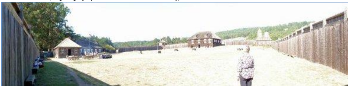
Fort Ross 2010 (Foto: Søren P. Petersen). Fort Ross er i dag et museum.