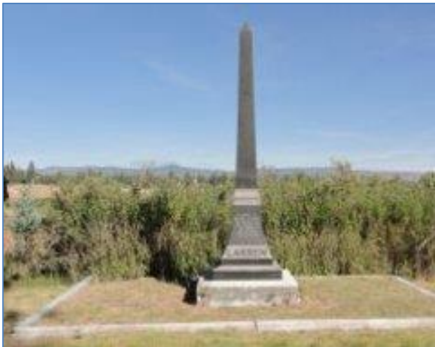
Monument ved Peter Lassens grav

Frimurerne og Susanvilles indbyggere har indrettet en lille park omkring graven, og frimurerne har rejst et monument til ære for Peter.