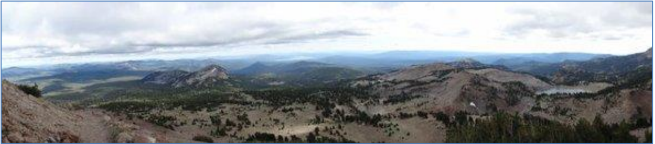
Lassen Volcanic National Park. Udsigten fra toppen af Lassen Peak.

Parken er et bjergrigt og vulkansk aktivt område med høje tinder og varme, boblene og svovlstinkende pytter. Lassen Peak er med sine 3.187 m.o.h. det højeste bjerg i parken. Det er vulkansk og var sidst i udbrud fra 1915-1917. I 1980 kom et andet bjerg, Mt. St. Helens, i Cascade-bjergene i udbrud.